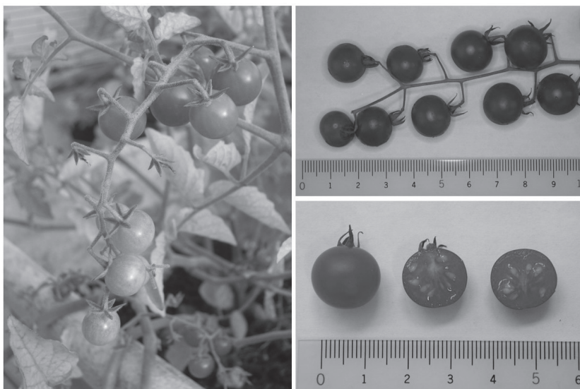
図1 マイクロトマト果実の形態

‘マイクロトマト’抽出液を試料として、HPLC 法によりアスコルビン酸濃度を測定した