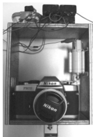
図4 ギア変更後のカメラ

1 4mmの内径の金属ギアはないので、市販されている内径3mmの金属ギアに合うようにシャフトを削る。シャフト自体の長さも短くして安定させ、箱のサイズも小さくする。