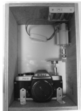
図3 カメラとモーターを固定するための外枠